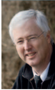
FOTOGRAF NIELS NYHOLM