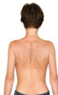
3. Sænk de samlede skulderblade ned.