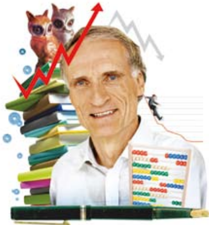
Af Bertel Haarder undervisningsminister (V)