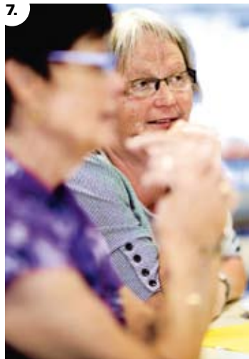
7.-10. Stemninger fra informationsmødet i HK/Midt.