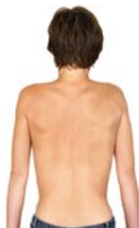
1. Løft af slappede skuldre op.

Denne øvelse modvirker spændinger og myoser (infiltrationer) i den øverste store rygmuskel (trapezius), som de fleste af os har problemer med, fordi vi sidder ned hele dagen. Øvelsen kan både laves siddende og stående - gerne mange gange om dagen.