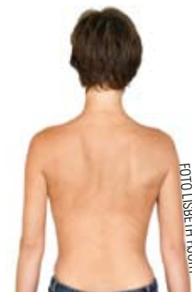
4. Slap af mellem skulderbladene, og lad dem glide ud til siden.