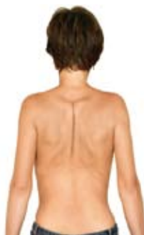
2. Saml skulderbladene.