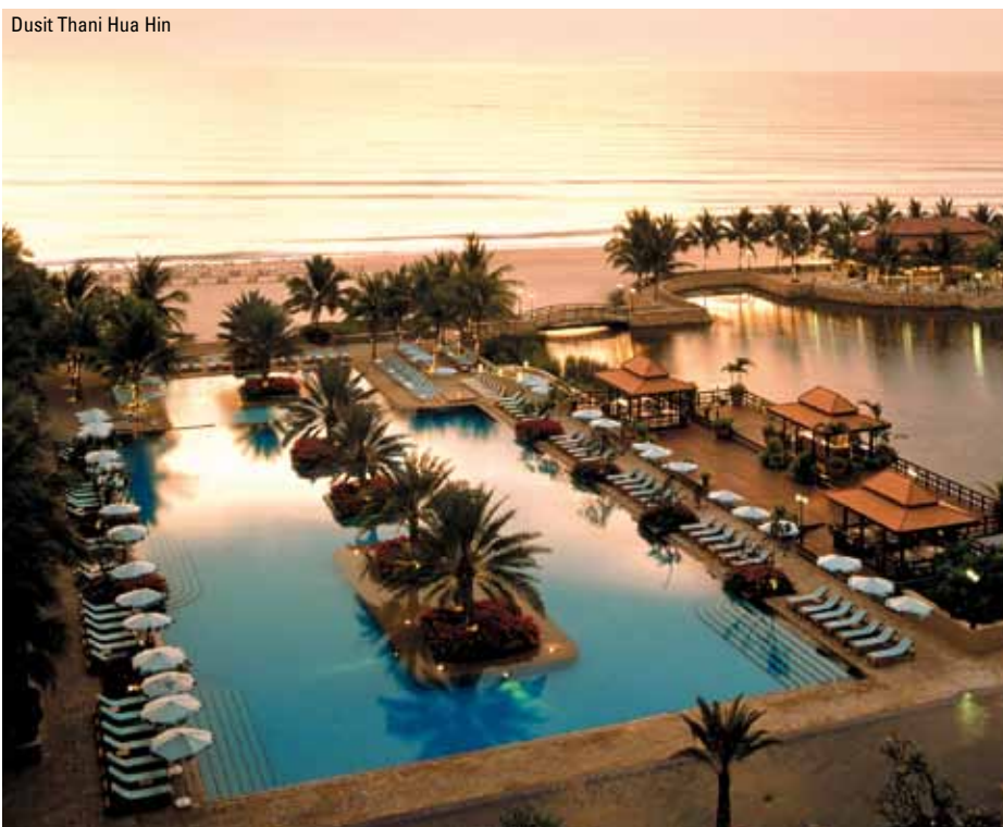
Dusit Thani Hua Hin

Lige fra I træder ind i receptionen på dette legendariske badehotel, kan I se, det er noget særligt. Her er tale om et 5-stjernet resort - det er ikke nyt, men er løbende renoveret. Indretning, faciliteter og betjening lever fuldt op til den høje popularitet og de talrige priser, hotellet har vundet. Alle værelser vender helt eller delvist mod havet, og det samme gør den ene af de to swimmingpools, hotellet kan tilbyde. Den anden swimmingpool er med saltvand og placeret i en stille have til dem, der foretrækker fred og ro. Alle superior-værelser er yderst rummelige og pænt indrettede, har alle moderne faciliteter, samt balkon, der vender ud mod poolen og begrænset havudsigt. Hotellet tilbyder alle former for aktiviteter: Tennis, squash, ridning, fitnesscenter og et stort udvalg af vandsport. Tæt på ligger flere golfbaner i topklasse, som hotellet gerne hjælper til med at booke. Der er flere forskellige restauranter på hotellet - både italiensk, fransk og thailandsk, og chefkokken, som er fransk, har været på hotellet i næsten 20 år og sørger for, at maden lever op til den høje standard, som findes overalt. Dusit Thani Hua Hin ligger 10 minutters kørsel nord for Hua Hin og tilbyder shuttle-bus service hver time (50 baht pr. vej). På den måde er det nemt at komme til f.eks. det berømte natmarked i Hua Hin, men samtidig at kunne trække sig tilbage og nyde freden på den private strand ved hotellet.