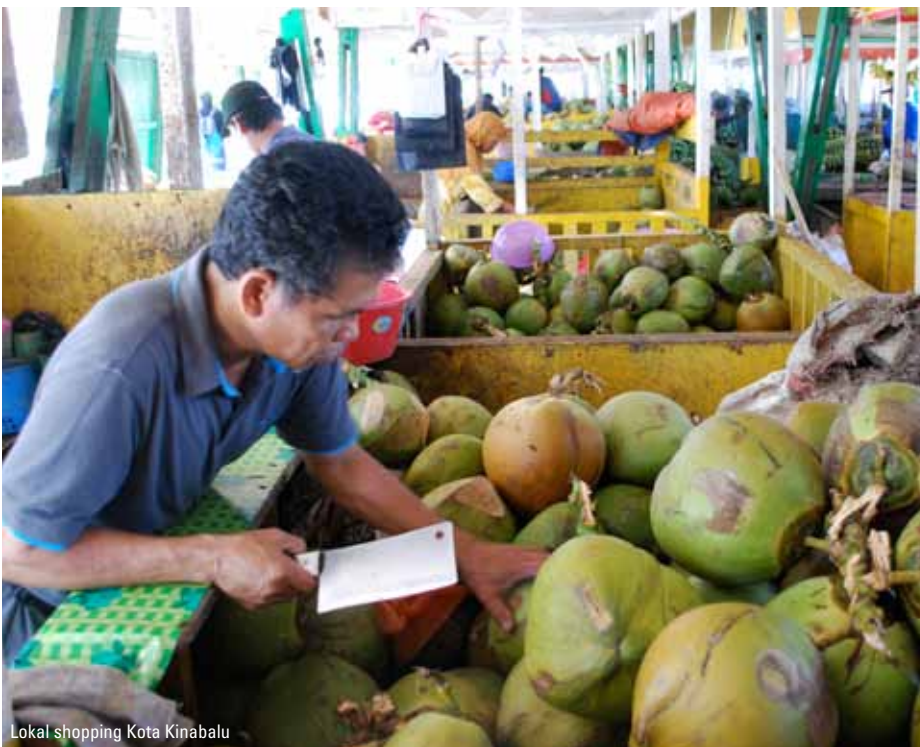
Lokal shopping Kota Kinabalu