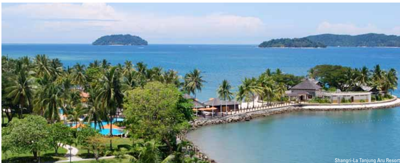
Shangri-La Tanjung Aru Resort