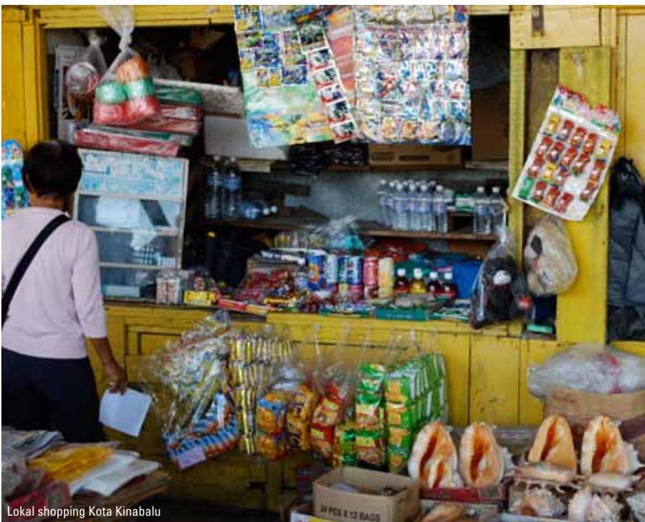
Lokal shopping Kota Kinabalu