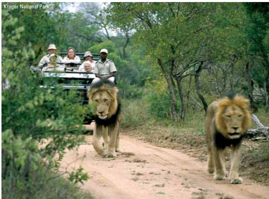
Kruger National Park

Vi har både picnic morgenmad og lunch med, som vi indtager på et af de få steder, hvor det er tilladt at stige ud af jeepen. Én af dagene køres safarier i bussen. Overnatning