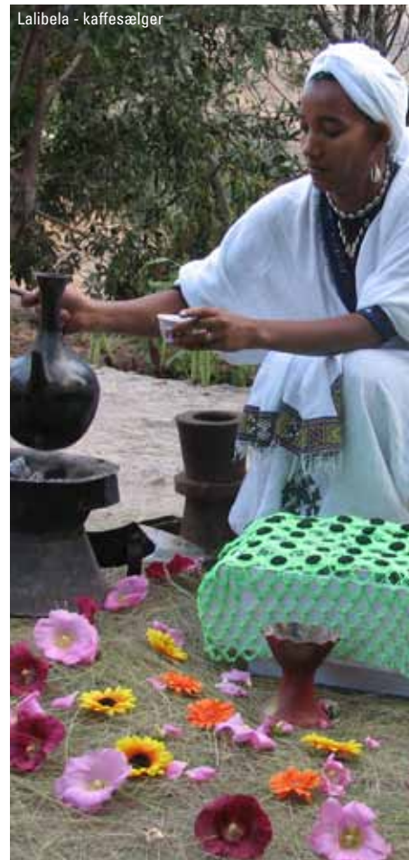
Lalibela - kaffesælger

Lalibela anses for at være én af Afrikas største attraktioner og er en af denne rejses absolutte højdepunkter. Lalibela blev grundlagt i begyndelsen af 1200-tallet af kong Lalibela. Intentionen var at befæste et nyt dynasti, ved at bygge et nyt Jerusalem, efter at korstogsriddere i 1187 havde tabt Jerusalem til Saladin. Tilbage står i dag 11 kirker, som hverken blev bygget af sten eller tegl, men hugget ud dybt nede i den flade klippe. Lalibelas unikke arkitektur er et af de steder, som må opleves, og som kun forstås, når man ser det i virkeligheden. Lalibela er endvidere et af de vigtigste pilgrims mål i Etiopien.