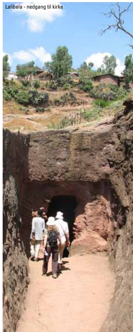
Lalibela - nedgang til kirke

Fortsat besøg i Rift Valley. Dagen slutter med, at vi kører tilbage til lufthavnen i Addis, hvorfra vi flyver til Danmark.