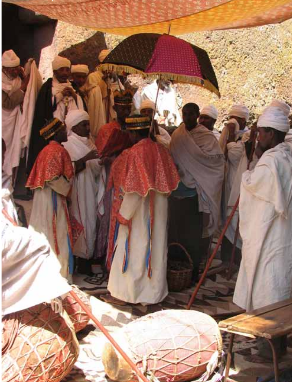
Lalibela - messedrenge