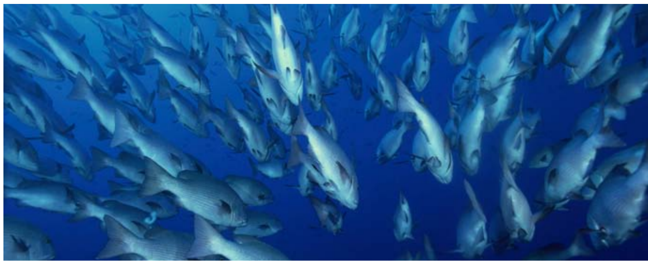
NO TRAFFIC JAMS – River snappers, or Lutjanus argentimaculatus