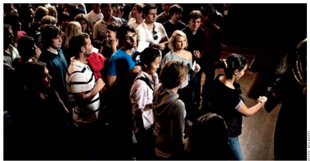
REKTOR RÆKKER HÅNDEN FREM – Træd frem fra mængden. Ny kampagne efterlyser studerende med gode ideer til at gøre uddannelserne bedre.

»Centrene fylder efterhånden meget i det samlede billede, og alle kan indse, at hvis vi fortsætter udviklingen, hvor forskningsfyrtårnene ikke underviser, mister vi et vigtigt aspekt i forhold til den forskningsbaserede undervisning. Men det er ikke sådan, at de eksternt ansatte forskere skal overtage undervisningen, og vi så skal afskedige alle de fastansatte, for så kan de eksterne ikke passe deres forskning og leve op til kontrakten med bevillingsgiveren,« siger han.