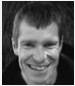
By Mike Young Editor, University Post

YOU CAN EASILY get by in Copenhagen with no Danish whatsoever. Most people here speak good English, and they practice it at every opportunity.