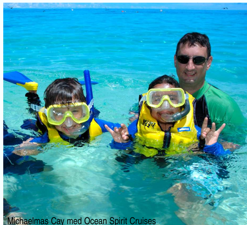
Michaelmas Cay med Ocean Spirit Cruises