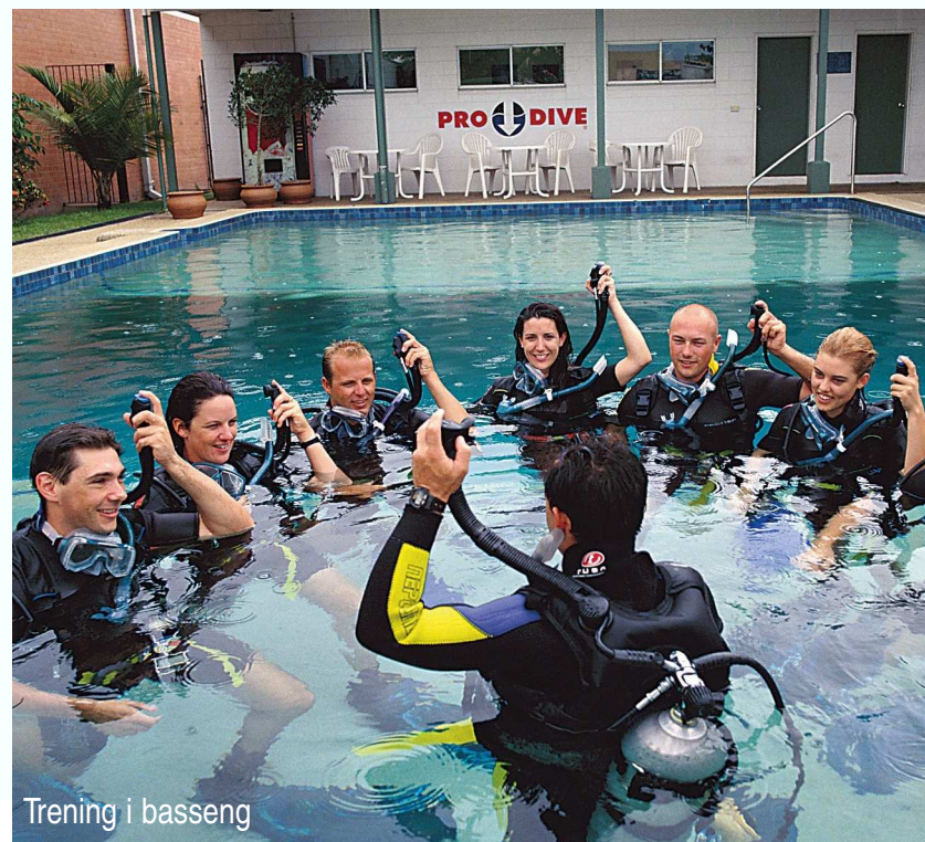
Trening i basseng