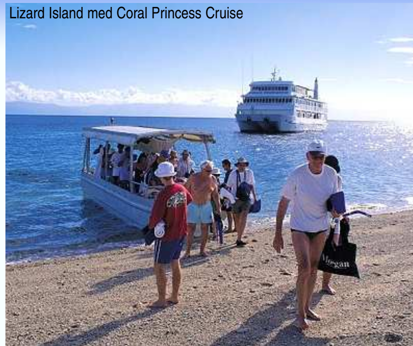
Lizard Island med Coral Princess Cruise

Tilbudene gjelder ved avreise i periodene 15. februar 2010-3. juli 2010 og 17. august 2010-30. november 2010 og bestilling seinest 5. februar 2010.