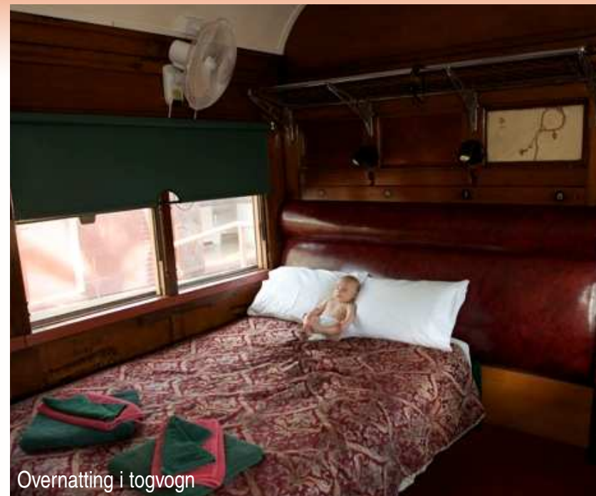
Overnatting i togvogn