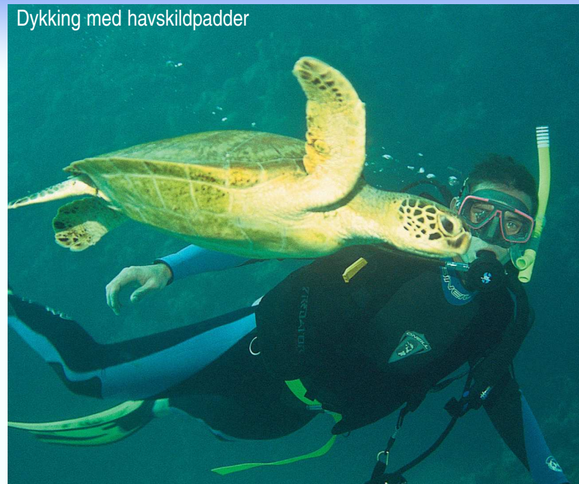
Dykking med havskildpadder

Dette dykkerkurset er PADI sertifisert, så du vil motta et PADI dykkersertifikat som gjelder for dykking i hele verden.