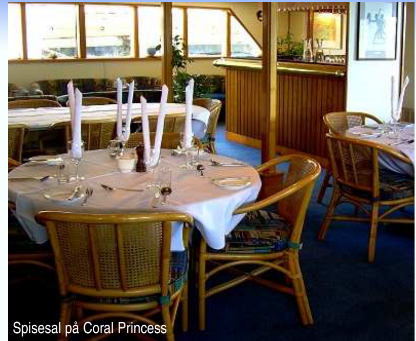
Spisesal på Coral Princess

Men det aller beste ved et Coral Princess Cruise er at det er du som er i førersetet med tanke på hva som skal skje. Valget er helt deres! Om du vil snorkle og dykke og oppleve det fasinende undervannslivet med alle de fargestrålende fiskene, eller bare slappe av på dekket eller i spaen mens vi seiler forbi den enestående naturen.