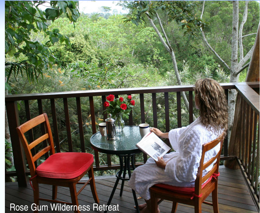
Rose Gum Wilderness Retreat