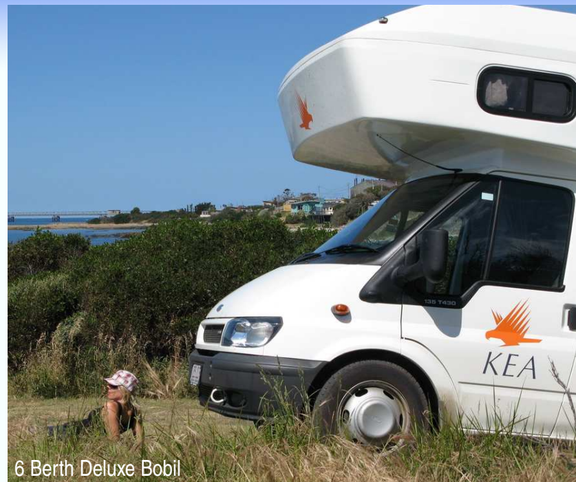
6 Berth Deluxe Bobil

Tilbudene gjelder ved avreise i periodene 15. februar 2010-3. juli 2010 og 17. august 2010-30. november 2010 og bestilling seinest 5. februar 2010.