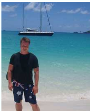
Les Renes blogg om hans tur med Coral Princess

Personalet er alltid mulig å få tak i og yter assistanse og gir informasjon om det fasinende livet på revet. Vår marinebiolog forklarer grundig om de mange underne som avslører seg gjennom glassbunnen på båten vår, og våre profesjonelle dykkerinstruktører står parate til å introdusere deg til SCUBA dykking, som kan bringe deg enda tettere på de spesielle opplevelsene.