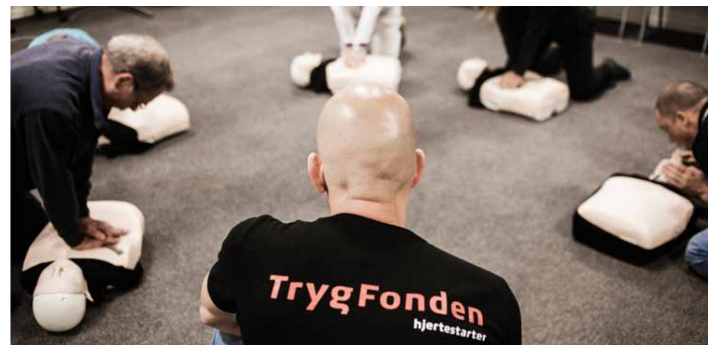
TrygFondens Hjertestartere har i perioden 2006 til oktober 2014 reddet 52 liv. Hvert år uddeler TrygFonden 100 hjertestartere og uddanner den danske befolkning i livreddende førstehjælp.

Alle skal have et sikkert og trygt møde med sundhedsvæsenet. Men hvert år kommer patienter til skade eller dør på grund af utilsigtede hændelser, når de bliver behandlet. TrygFonden vil afprøve nye løsninger og styrke det forskningsmæssige fundament på området.