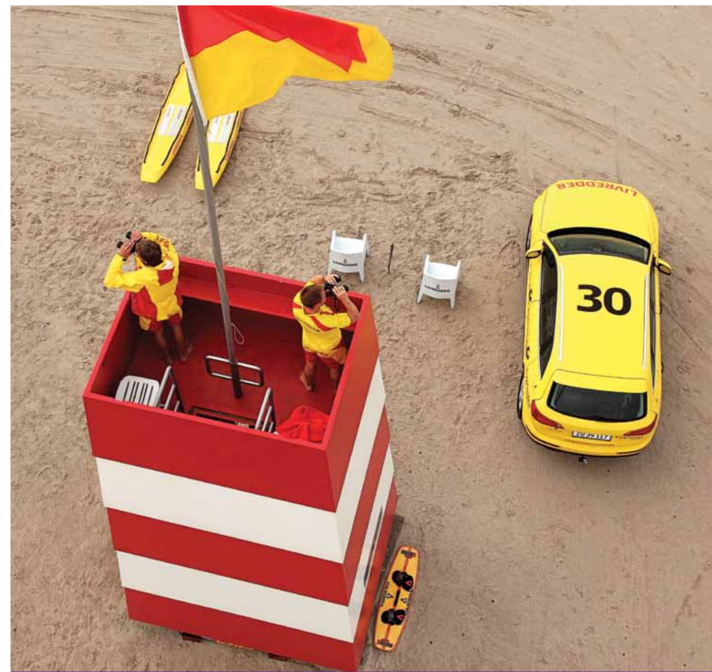
I 2014 var 200 livreddere fra TrygFondens Kystlivredning til stede på 36 strande og havnebade rundt om i Danmark. De udførte i sæsonen godt 60.000 indsatser.

Færre skal dø eller komme alvorligt til skade i brandulykker i private hjem. TrygFonden vil arbejde for, at der sættes flere røgalarmere op i private hjem, samt at børn og voksne ved, hvordan man undgår brand og er i stand til at handle, hvis der opstår brand.